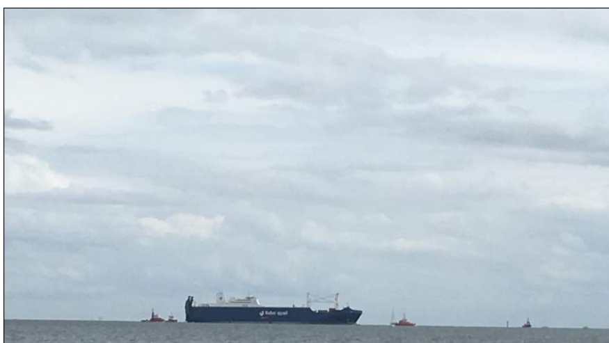
Statki oczekujące na wplynięcie do portu.