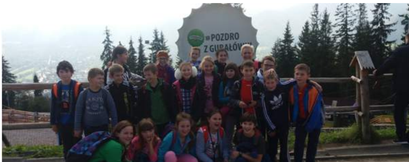
Gubałówka - 5b.

Powrót do szkoły to nie tylko lekcje- nauka, kartkówki, sprawdziany, ale także ciekawe zajęcia poza nią. Przykładem są wycieczki podczas, których możemy się wiele nauczyć. Z tym, że w tym przypadku wiedzę zdobywamy w trochę inny sposób. Przyjemniejszy? Pewnie wielu z Was odpowie, że tak. Klasom V udało się już we wrześniu wybrać na wycieczki: 5a w Pieniny a 5b do Zakopanego.