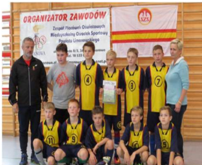
Pow. Igrzyska Młodzieży Szkolnej