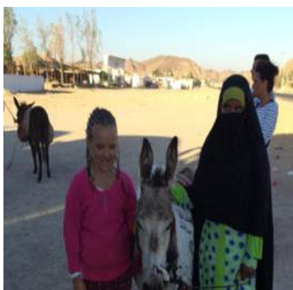
Ja z Beduinką. O.Piwowarczyk

Marzy mi się powrót do Egiptu, Grecji i Gdańska. Zobaczcie, jak tam jest pięknie. Oto moja mała fotorelacja.