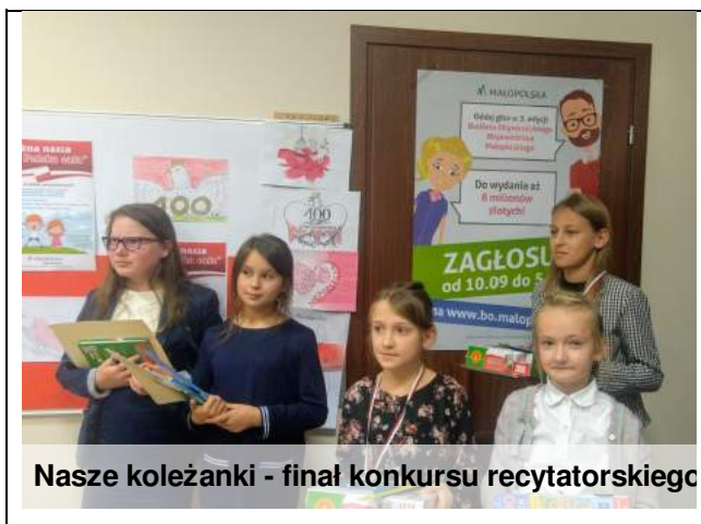
Nasze koleżanki - finał konkursu recytatorskiego

Podsumowanie konkursu recytatorskiego "A ja jestem Polak mały" zorganizowanego przez Stowarzyszenie LGD "Przyjazna Ziemia Limanowska" już za nami. Konkurs miał na celu rozwijanie zdolności recytatorskich dzieci, popularyzację utworów literackich o tematyce patriotycznej oraz budowanie postaw patriotycznych młodego pokolenia.