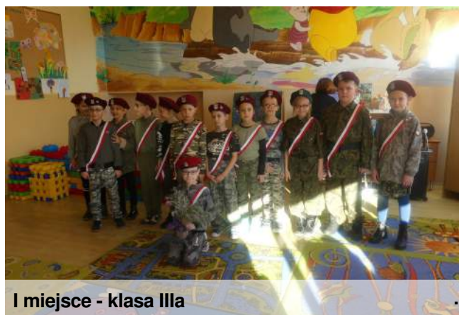
I miejsce - klasa IIIa