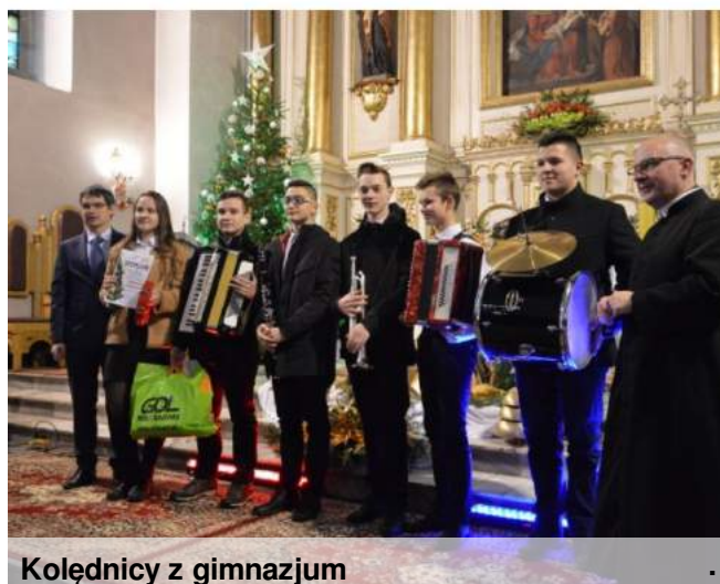
Kolędnicy z gimnazjum