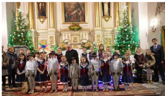
Kl. IIb (z tyłu z gwiazdą)