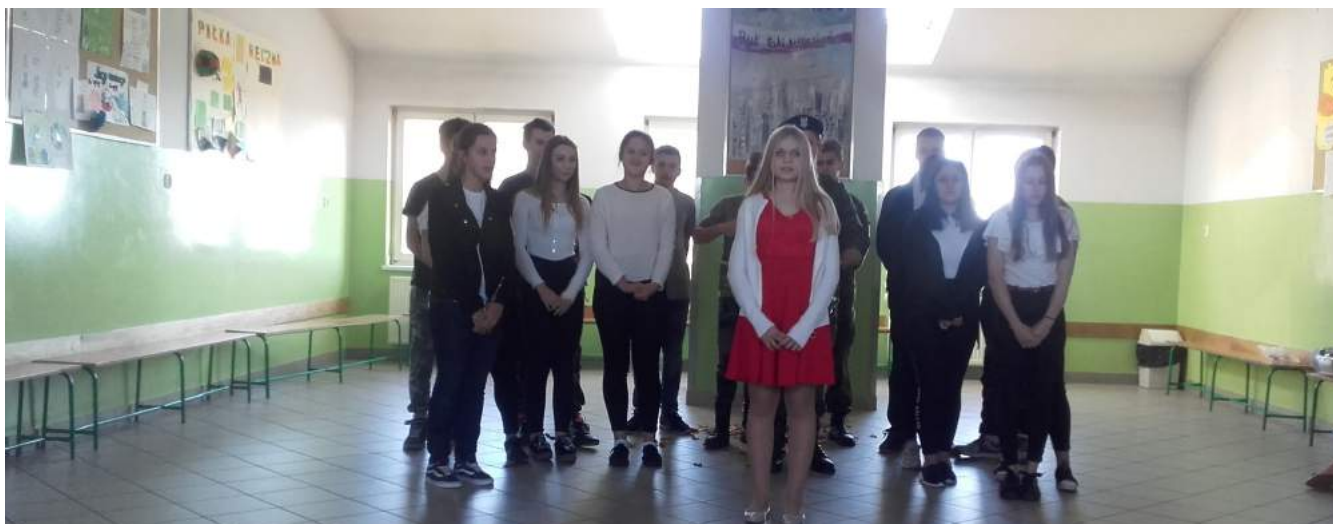
I miejsce - klasa IIIc