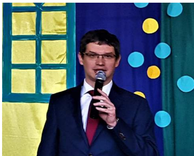
Przemówienie Pana Wójta