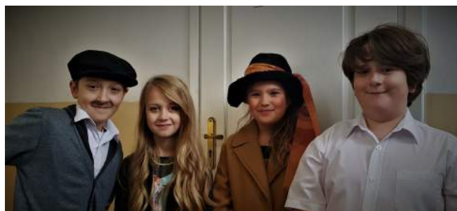
Artyści z koła teatralnego