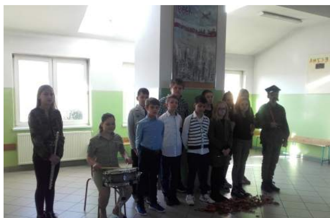
I miejsce - klasa VIb

II miejsce klasa 7b, III miejsce klasa 7a.